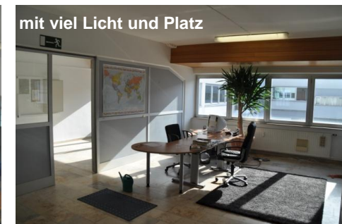
mit viel Licht und Platz