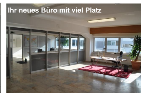
Ihr neues Büro mit viel Platz