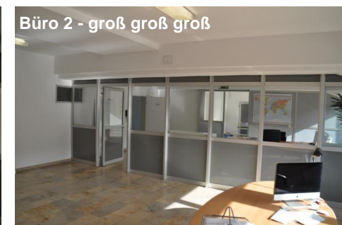
Büro 2 - groß groß groß